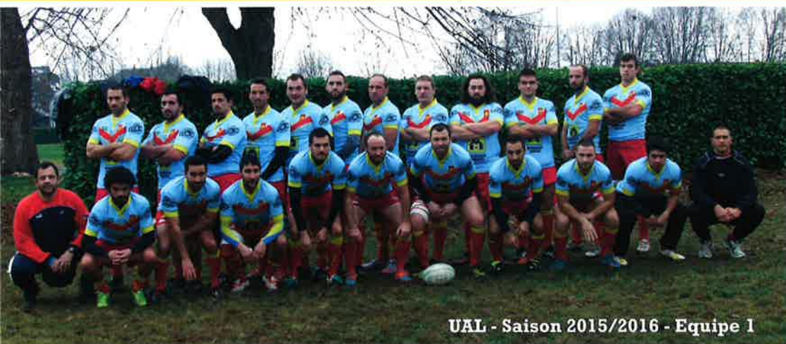
UAL - Saison 2015/2016 - Equipe 1