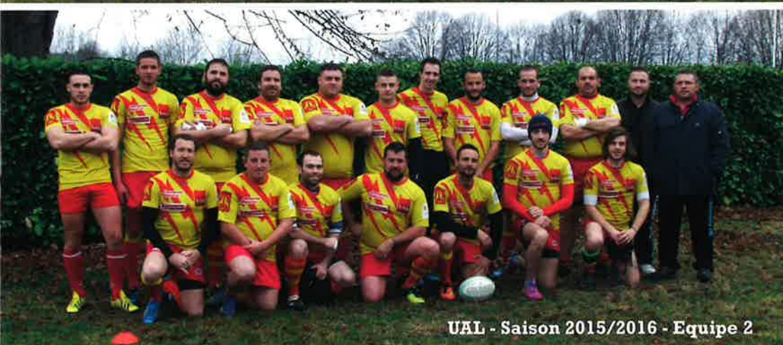
UAL - Saison 2015/2016 - Equipe 2