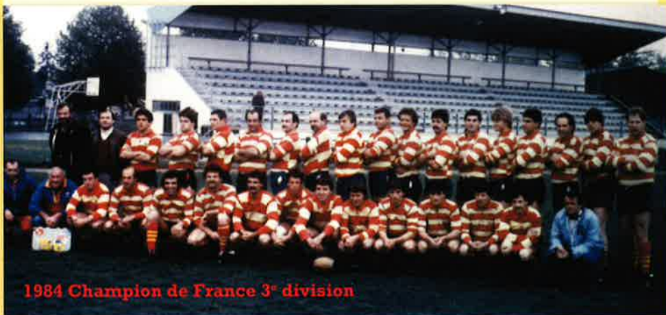
1984 Champion de France 3 e division